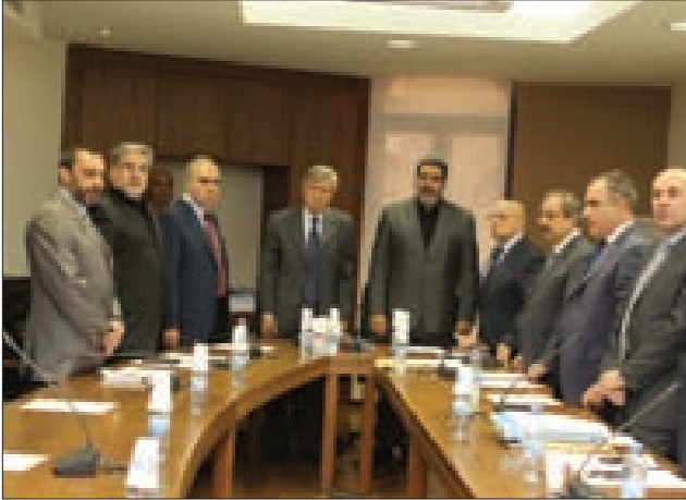
لجنة الإدارة والعدل... دقيقة صمت على أرواح شهداء الجيش

رفعت لجنة الإدارة والعدل جلستها إلى يوم الإثنين المقبل، وذلك تضامناً مع الجيش اللبناني.