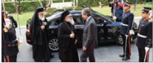
رئيس الحكومة اليونانية يستقبل البطيريك يازجي

وأكد الجانبان «ضرورة تفعيل كل السبل العملية التي تساعد على تثبيت المسيحيين وغيرهم من أطراف المشرق في أرضهم»، كما شدّد على «عمق العلاقة التي تربط كنيسة أنطاكيا باليونان».