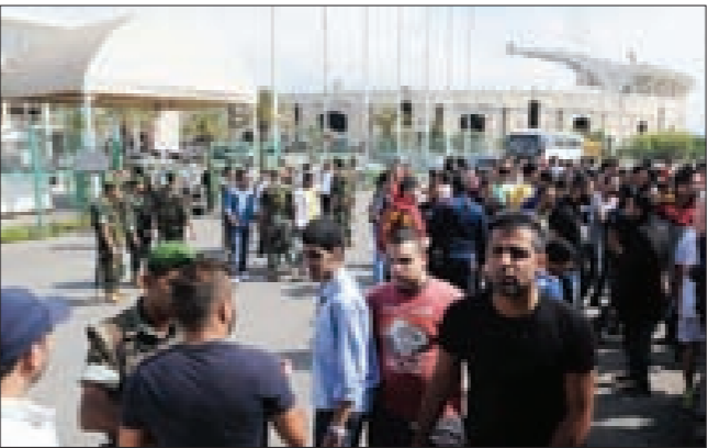
شغل جمهور الكرة اللبنانية بدخول المدرجات

قرر الاتحاد اللبناني خفض سعر بطاقات الدخول إلى الملاعب من 10 آلاف ليرة لبنانية إلى 5 آلاف ليرة لبنانية، وذلك بناء على مطالبة بعض الأندية بذلك، تشجيعاً لزيادة الإقبال الجماهيري على مباريات الدوري والبطولات الرسمية المحلية.