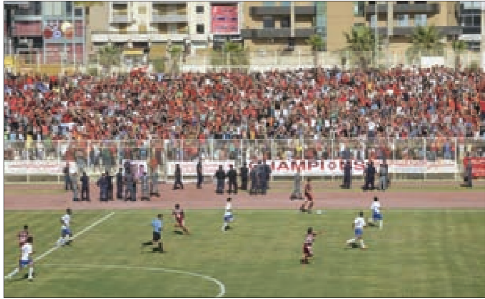
من لقاء الراسينغ والنجمة في إياب الموسم الماضي

تقام بعد ظهر اليوم المباراة الختامية من الجولة السابعة في الدوري اللبناني لكرة القدم، فيلتقى على ملعب صيدا البلدي، الراسينغ السادس بـ10 نقاط مع النجمة الخامس بـ13 نقطة.