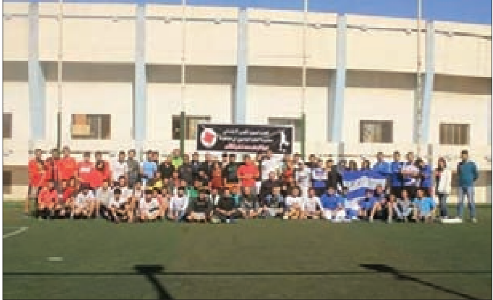
... والمشاركين في مباريات كرة القدم

أقامت مديريةية أبيدجان في الحزب السوري القومي الاجتماعي احتفالاً بمناسبة عيد التأسيس، حضره جمع من القوميين وأبناء الجالية. وتلّى في الاحتفال بيان الحزب في المناسبة، ثم ألقى مدير المديرية كلمة أشار فيها إلى مضامين المناسبة ومعانيها،