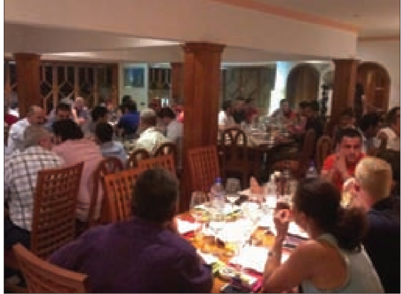
من احتفال توغو