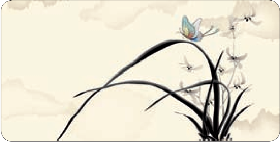
صباح الخير في فيينا، صبايح من صيدنايا إلى القلمون، 2014

عام 1984 بشراكة عمر مع الرئيس نبيه بري والشهيدين عماد مغنية ومحمد سعد، وفي السادسة والخالفين، كنت استعد لمسيرة المجلس الوطني للاعلام لتأسيس الاعلام المرئي والمسموع في لبنان ودخول السياسة الرسمية من يابه إلى النيابة عام 2000، متوجّا العام 2004 في السادسة والأربعين حربا على القرار 1559، فصرّت نظاراً له مقابل تيّري رود لارسن، يتقاتل في برية بلادنا، على حرية استقلالنا. وها أنا اليوم في السادسة والخمسين، أعود كاتباً ومحاوراً ومتحدثاً فقط، أي ما أراه أصل البدء والتأسيس والتاصيل، من موقعي في رئاسة شبكة «توب نيوز»، التي أفرّح بانها إنجاز واعجاز. ورئاستي لتحرير جريدة «البناء» التي أجد فيها للمزيد من فخر النهضة والبناء، أقول لكم أنا اليوم ناصر قنديل معكم حتى انقضاء النفس. صباحكم خير ومقاومة ونصر وعملآ.