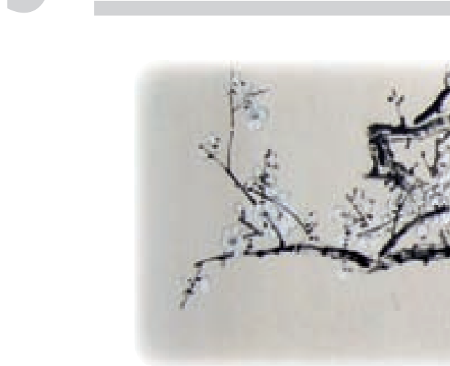
صباح القراء، صبايح من صيدنايا إلى القلمون، 2014