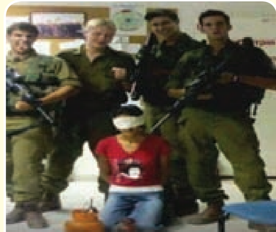
صورة يجب أن تصل لكل العالم تفضح جرائم الإحتلال الصهيوني في فلسطين ما طبعك إلا الضمطر زر المشاركة فقط

هنا صورة تداولها الناشطون على صفحات «فايسبوك»، تظهر بعض المهجين الصهاينة وهم يقومون بإذلال فتاة لا ذنب لها سوى أنها فلسطينية، يضحكون ويشتمون لهذا الإذلال. في هذه الصورة ترى أقسى أنواع الوحشية وأبرز عناوين الإزساب والإجرام، والمجزان أن الرأي العام العالمي لا يزال ساكناً عن هذه الجرائم.