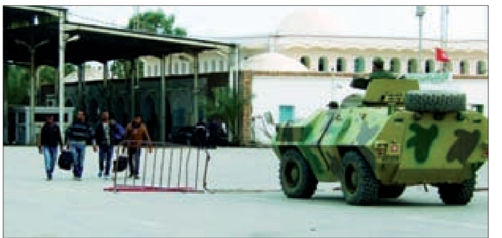
يعبرون الحدود التونسية - الليبية

معسكرات تدريب شرق ليبيا تضم نحو 200 مسلح، لكنه استبعد قيام القوات الأميركية بعملية عسكرية في ليبيا، على غرار ما يجري في سورية والعراق، مضيفاً أنه لم تصدر توصيات للقوات الأميركية أو القوة الجوية بملاحقة معسكرات التدريب في الوقت الراهن. وتأتي هذه التطورات الميدانية بعد 24 ساعة من شن الجيش الليبي هجمات مكثفة على مناطق يتحصن فيها المسلحون في بنغازي، في محاولة للقضاء على المتشددين الذين انسحبوا من معظم أنحاء المدينة. سياسياً، تُعدّ اليوم في غدامس الجولة الثانية من الحوار الوطني الليبي بين الأطراف المتنازعة بالبلاد الذي دعت إليه بعثة الأمم المتحدة لدى ليبيا، برعاية مبعوثها الأممي برناردينو ليون، إذ وجه الاتحاد الأوروبي ما اعتبره «النداء الأخير» إلى فرقاء النزاع في ليبيا كافة، للقبول بالحوار حلاً للصراع الدائر. وتذكرت مصادر أن الجيش الليبي يشن منذ السبت الماضي هجمات مكثفة على مناطق يتحصن فيها مسلحون ليبيايون ينتمون إلى ما يعرف بـ«كتيبة البتار» التي أعلنت ولاءها لتنظيم «داعش» في مدينة بنغازي شرق البلاد، وظهرت صور بثتها مواقع على الإنترنت سيارة تحمل «علم داعش»، إضافة إلى عدد من الشباب يتحدت بعضهم بلكتة أجنبية، وكانوا في طريقهم إلى بنغازي آتين من درنة، وكانت القيادة الأميركية في أفريقيا أعلنت قبل أيام وجود معسكرات تدريب «داعش» شرق ليبيا تضم مئات المسلحين.