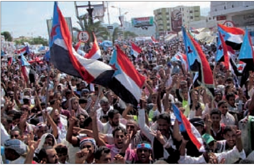
يطالبون بالانفصال عن الشمال

صباحاً حتى الواحدة ظهراً. وأضاف: «العصيان المدني هو السلاح الأقوى لتعطيل مصالح الاحتلال اليمني والانفصال عنه». وركز العصيان المدني الذي أدى إلى شل الحركة التجارية وحركة المواصلات في مديرية كريتير والمعلا وخورمكسر. وأوضح الديبسي أنهم سيستمرون في تلك الخطوة التصعيدية خلال الأيام المقبلة، مشيراً إلى أن هناك خطوات تصعيدية أخرى تستهدف النقابات العمالية والمؤسسات الحكومية. وبحسب مصدر محلي، فإن منفذي العصيان المدني قاموا بإحراق الإطارات وإغلاق الطرقات في الشوارع، ما أدى إلى حدوث مناوشات مع قوات الأمن أدت إلى سقوط جريح. وكانت قوى الحراك دعت سكان المدينة عبر مكبرات الصوت ومنشورات وزعت في شوارع المدينة إلى التزام تنفيذ العصيان المدني وتشل الحركة.