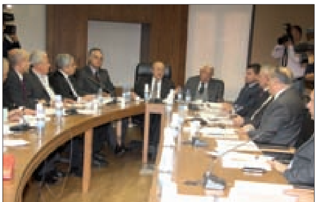
اللجنة مجمعة في المجلس النيابي

ناقشت لجنة الأشغال العامة والنقل والطاقة والمياه، الإشغال غير القانوني للأمالك البحرية وتطلب لائحة جديدة بالمخالفات وتصنيفها، في جلسة عقدتها عند العاشرة والنصف قبل ظهر أمس، برئاسة النائب محمد قبايني. وإثر الجلسة، أشار قبايني إلى أنّ «اقتراح القانون عنوانه «معالجة الإشغال غير القانوني للأمالك العمومية البحرية»، وليس تسوية المخالفات»، ذلك أننا نعتبر أنّ «الشاطي» ليس ملكاً لجيلنا نتصرف به كما نشاء بل ملك الأجيال المقبلة من اللبنانيين. وبالتالي فإنّ هذا الاقتراح يتناول غرامات لا تعطي أي حقوق مكتسبة للمخالفين». وأضاف: «اتفق على أنّ المعيار لمقاربة الموضوع هو الصلحة الوطنية والمعيار القانوني وليس معيار المداخل التي يمكن جبايتها، كما تقرّر طلب رأي خطي من هيئة الاستشارات في وزارة العدل للتأكد من عدم ترتيب أي حقوق مكتسبة ولا بطريقة غير مباشرة، كذلك طلب الرأي الخطي حول الاقتراح من وزارات الأشغال العامة