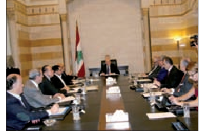
خلال الاجتماع في السراي

رأس رئيس الحكومة تمام سلام صباح أمس في السراي الحكومية، اجتماعاً للجنة معالجة النفايات الصلبة في حضور كامل أعضائها. وأشار وزير البيئة محمد المشوق بعد اللقاء إلى أنّ «اللجنة ناقشت التصورات في شكلها النهائي الموضوعة لمعالجة النفايات الصلبة، التي من المفترض أن تقدم إلى مجلس الوزراء في الجلسة المقبلة». وأضاف: «هناك تصورات مكملة، ودخلنا أيضاً في بعض التفاصيل إن لجهة دفاقر الشروط أو المناطق، وتكونت صورة واضحة لدى الجميع بما فيها المبادئ، بمعنى كيفية إنهاء هذه الأزمة وتحويلها إلى طاقة».