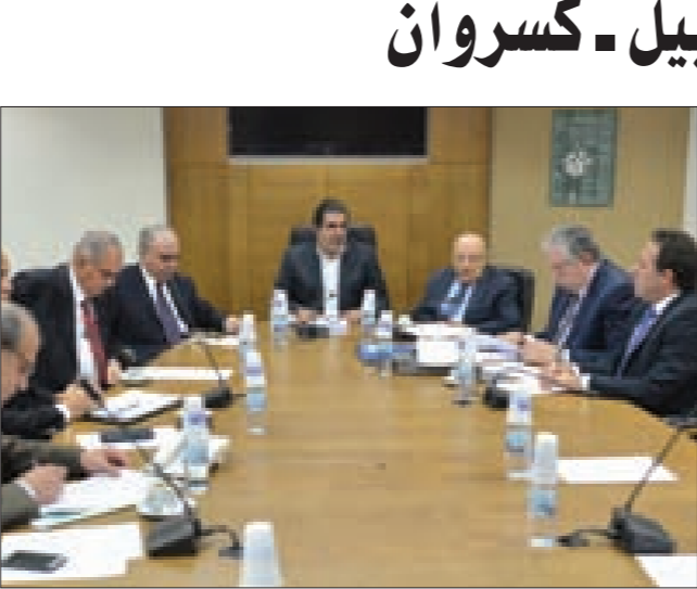
الساحلي مترشساً فرعية الادارة