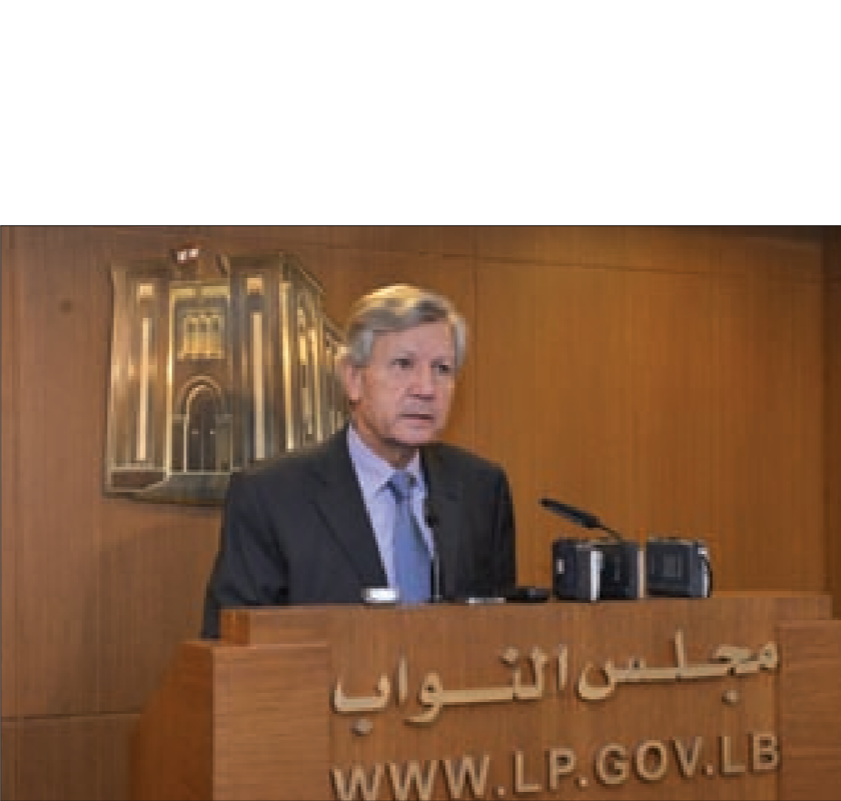
غانم متحدثاً بعد الاجتماع