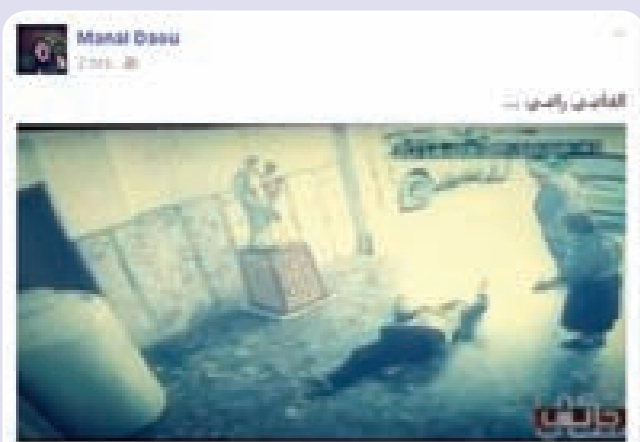
بالفيديو: قاضية لبنانية تضرب على مواطنها بالضرب المبرح

فور شيوخ الخبر، انتشر على مواقع التواصل الاجتماعي الفيديو المصور لهذه «الفضيحة» التي ارتكبتها القاضية، ومطالب مدعي عام المباحث الجنائية بفتح تحقيق فوري في القضية، خصوصاً بعد عرض الفيديو المصور في حلقة الإثنين من برنامج «حكي جالس» على شاشة «إل بي سي»، لكن هل يأخذ العدل مجراه وتحاسب القاضية؟