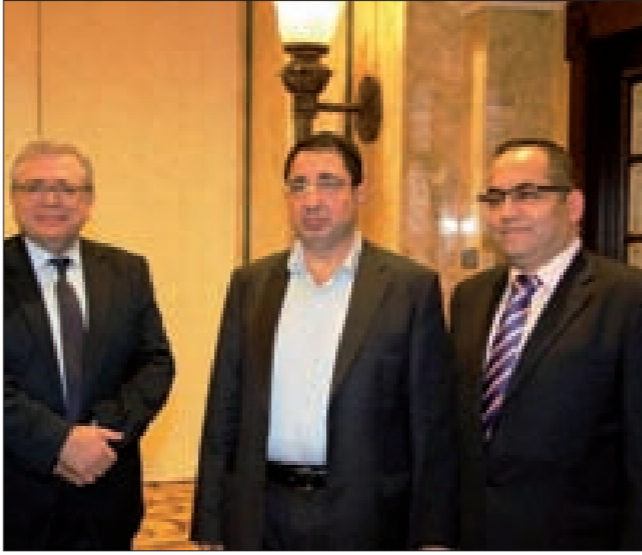
الحاج حسن متوسلاً جَمَيْلَ والعبد الله

شدد وزير الصناعة حسين الحاج حسن على «ضرورة العمل من أجل رفع قيمة الصادرات من 3 مليارات دولار سنوياً إلى خمس مليارات دولار، وتخفيض حجم الاستيراد من 20 إلى 16 مليار دولار»، معرباً عن «افتخاره بالصناعة الوطنية»، داعياً الصناعيين إلى «تشكيل لوبي ضاغط من أجل حماية ودعم القطاعات الإنتاجية في لبنان».