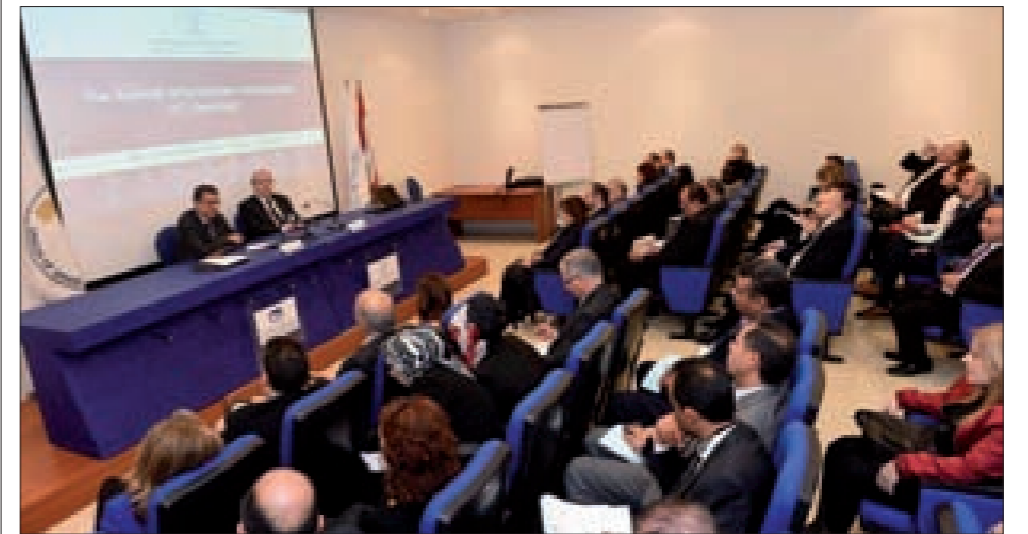
جانب من الحضور خلال الملتقى

وأشار إلى أنّ «إدارة تكنولوجيا المعلوماتية تعمل