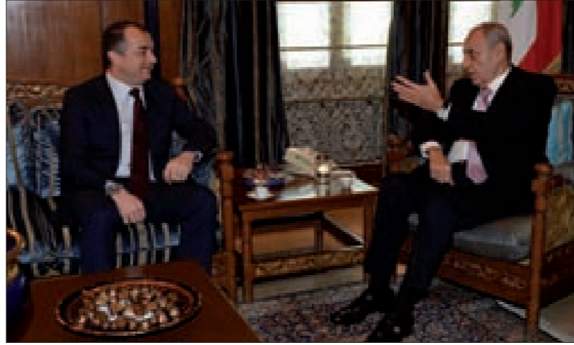
بري وبوصعب في عين التينة

لفت وزير التربية والتعليم العالي الياس بوصعب إلى تقارب أفكار في ملفي النفط والغاز، متوقفاً أنّ تشهد الأيام المقبلة حلحلة على هذا الصعيد.