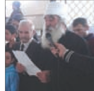
الشيخ أبو عساف