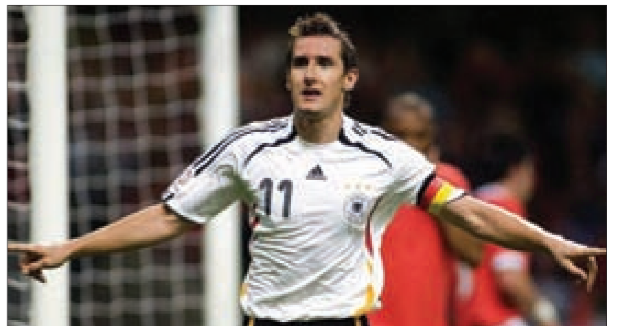
ميروسلاف كلوزه يحطّم رقم الظاهرة رونالدو