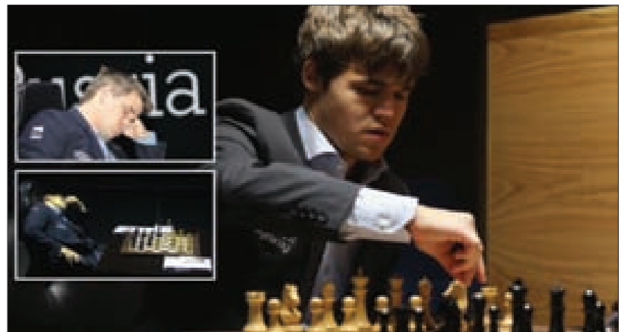
النرويجي ماغنوس كارلسن يتال بطولة العالم في الشطرنج للمرة الثانية على التوالي رغم نومه خلال المباراة!