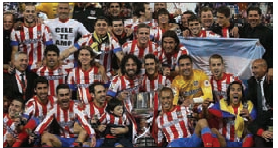
فوز أتليتيكو مدريد بالدوري الإسباني للمرة الأولى منذ عام 1996