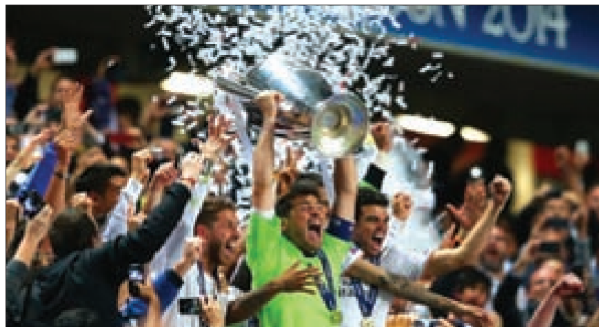
ريال مدريد يتوجّ بطلاً لدوري أبطال أوروبا للمرة العاشرة في تاريخه