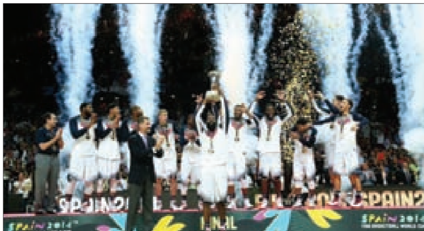
المنتخب الأميركي يتوجّ بالذهب في كأس العالم للسلة للمرة الخامسة في تاريخه