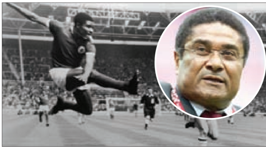
مرعب الحراس والدفاعات أوزبيبو يغيِّبه الموت