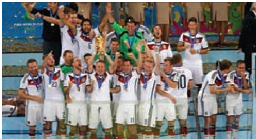
المنتخب الألماني يتوجّ بطلاً لكأس العالم للمرة الرابعة في تاريخه بعد 24 سنة على الكأس الثالثة