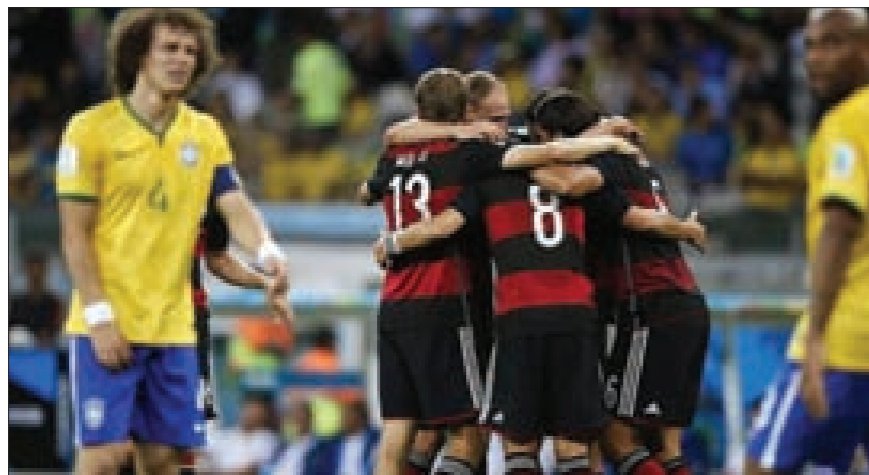
المانشافت يسحق بلاد الساميا بسباعية تاريخية في ليلة بكت فيها عيون البرازيليين