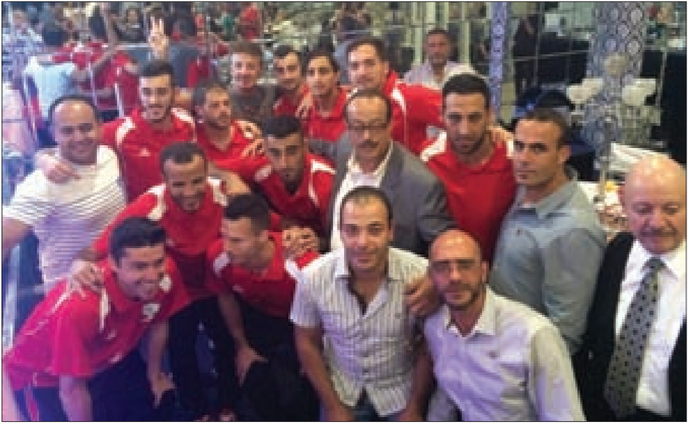
المنفذ وأعضاء الوفد مع المنتخب الفلسطيني

وإذ أعرب الأيوبي عن تمنياته بفوز منتخب فلسطين وحصوله على الكأس الآسيوية، شدد على أهمية انتصارات شعبنا في فلسطين والأمة. أشاد رئيس المنتخب بدور الحزب السوري القومي الإجتماعي، لافتا إلى أن المنتخب يعزّز ويفخر بشرف تكريمه من قبل الحزب القومي.