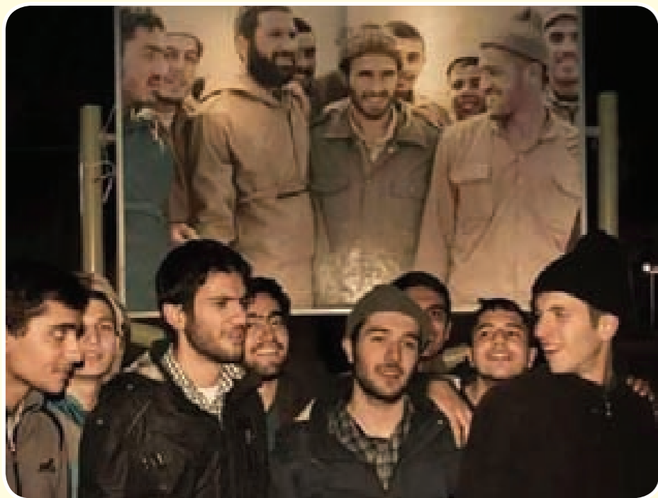
«من شابه أباه فما ظلم!»

انتشرت هذه الصورة على «فايسبوك»، وتداولها الناشطون في ما بينهم. للوهلة الأولى ينظر إليها الناشط العادي على أنها ليست سوى محاولة لتقليد بضعة شبان صورة قديمة، لكنها في الحقيقة صورة لبناء شهداء اجتمعوا لتمثيل مشهد لأبائهم الراحلين، فارتدوا ملابس مشابهة، ووقفوا الوقفة نفسها، وقفة العز والصمود، فمن رحل ترك وراءه شبانا لإكمال المسيرة. نعم رحلوا وتركوا أبناءهم ليكملوا دورهم. وها هم أبناء الشهداء في الصورة نفسها، ومن بعدها سيكملون طريق الصمود والمواجهة، طريق المقاومة!