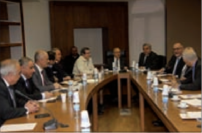
اللجنة مجمّعة في المجلس النيابي

استكمالاً للالتزام الحالي ومع العلم أنّ الشركة الملتزمة جيدة. واستمعنا إلى وجهة نظر إدارة المرفأ وحاجتها إلى مساحات إضافية للحاويات والنوع الجغرافي للمرفأ شرقاً وكذلك لاعد لمعد نهر بيروت، والحاجة لإنشاء الهيئة العامة للنقل البحري بسرعة، إضافة الى تطوير مداخل مرفأ بيروت مستقبلاً من أجل ضرورة الاستيعاب المستوي». وتابع: «كيف يمكن تازيم مشروع بقيمة حوالي 130 مليون دولار بالتراضي، مع العلم أنّه ليس