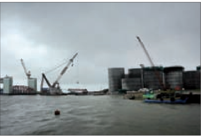
واردات الصين تجاوزت سبعة ملايين برميل يومياً

وتعلّأ الصين المرحلة الثانية من الاحتياطات الاستراتيجية منذ أنّ استكملت المرحلة الأولى عام 2009. وتقدر الاحتياطات حالياً بأكثر من 30 يوماً من واردات الخام، بينما تعترّم بكيّن بناء احتياطات بنحو 600 مليون برميل أو 90 يوماً تقريبا من الواردات.