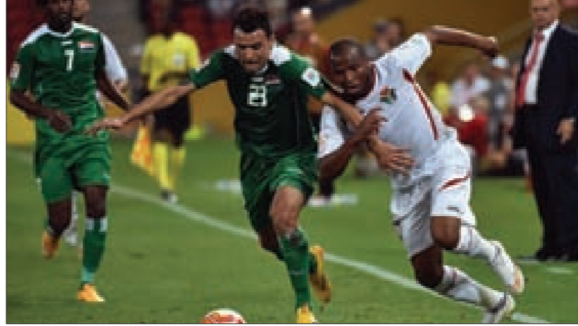
من اللقاء الذي جمع منتخبي العراق والأردن