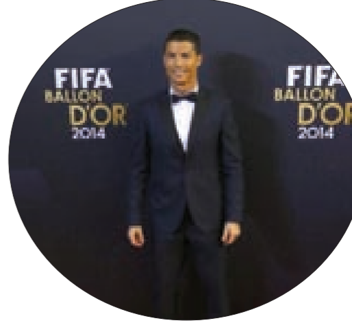
الفائز بجائزة كرة FIFA الذهبية 2014 البرتغالي كريستيانو رونالدو