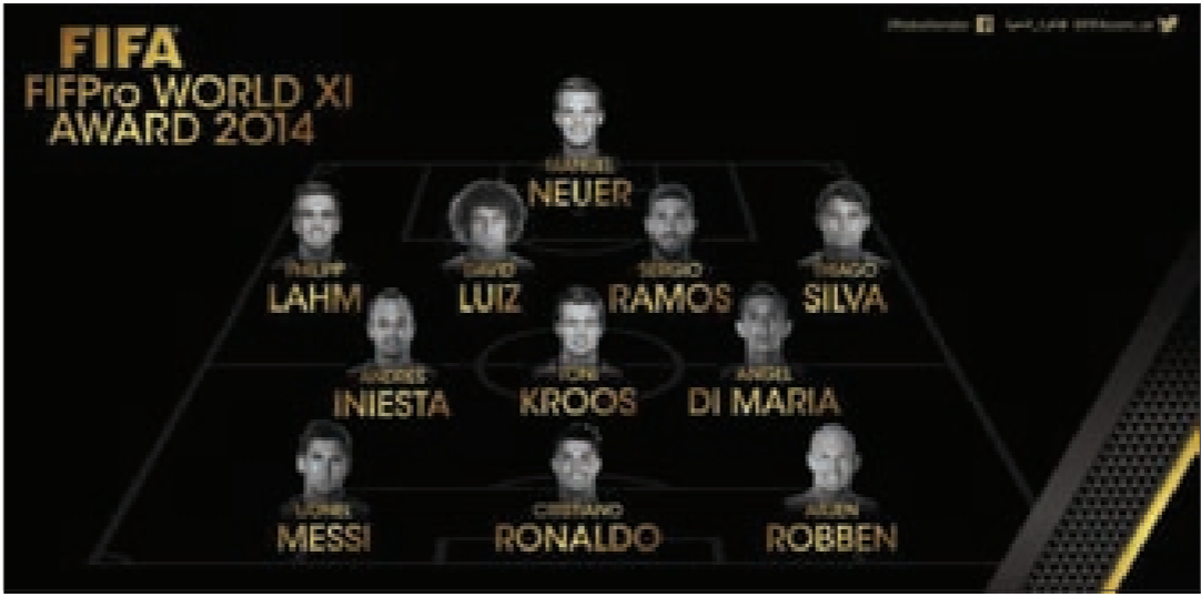
التشكيلة الفائزة بجائزة FIFA FIFPro World XI لأفضل 11 لاعباً في العالم