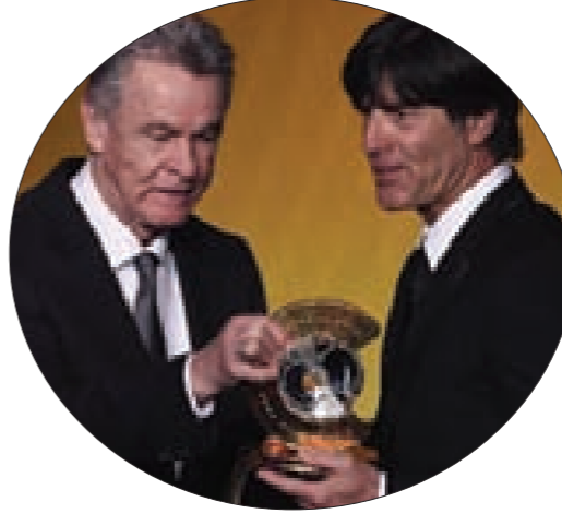
الفائز بجائزة أفضل مدرب بكرة القدم للرجال المدرب الألماني يواكيم لوف