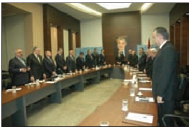
دقيقة صمت لكتلة المستقبل حداداً على شهداء تفجيري جبل محسن

خاصة في القرى والبلدات الحدودية»، وأكدت الهيئة أن الرابطة «ستواصل سعيها لدى أصحاب القرار للوصول ببلدنا إلى الإستقرار والسلام الدائم».