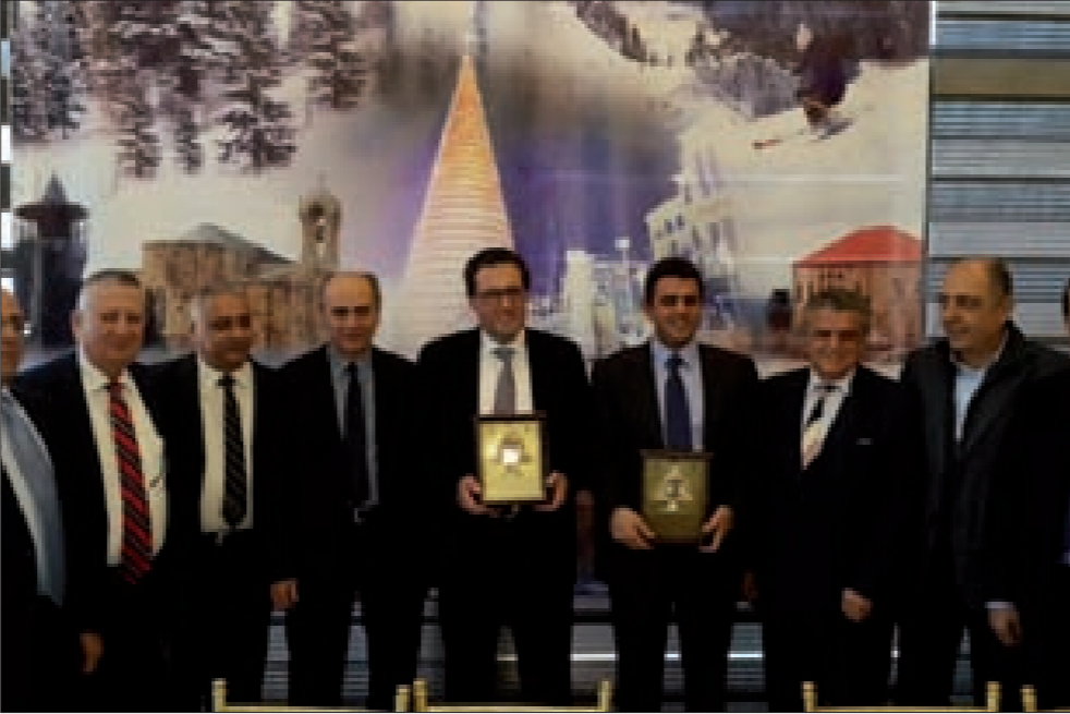
شقيـر بعد تسلمه الدرء التقديرية

أسواق خارجية تضارب سيأحة التزلج في لبنان عبوء: هبوء سعر النفض يوجب حففض كلفة تذاكر السفر