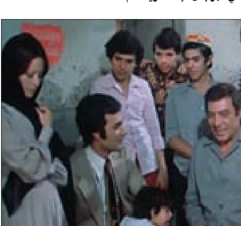
مع فريد شوقي و محمود ياسين في فيلم «أقواه وأرانب»