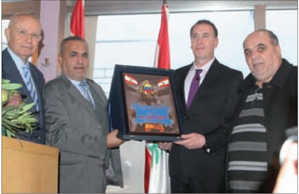
لبّس يتسلّم الدرع من سعد بحضور مراد (أحمد موسى)

دليل على أننا في حضرة رجل العلم والمعرفة والسياسة والوطنية والعروبة الحادة التي قل نظيرها فكان البقاع دائما على موعد بحد أفضل. ورحّب مراد بالضيوف واعتبر أنّ قرار النائب سليمان فرنجة في ترشيح المحتفى به، سفير لبنان في فنزويلا الياس لبّس قرار صائب. قرار وطني كونه لا يستند إلى شخصية طائفية أو مذهبية، لأن سيرة السفير لبّس سيرة إنسان عصامي ومتابع ونجاح وعلمي. وفرض أسلوبا جديدا في التعامل مع المغتربين. وقال: «إنّ لبنان يعتبر من أكثر الدول اعتراباً باعتبار أنّ لمنطقة في العالم أو دولة إلا وفيها لبنانيون»، مشيدا بدور المغتربين في حماية الاقتصاد الوطني، معربا عن أسفه لأنّ لبنان ما زال يعاني منذ إعلانه دولة، لأن الاستعمار الفرنسي ترك فيه علة الطائفية فيقضي يعاني الذهنية والتناقضات حتى بقي في كل استحقاق يعاني الصراخ. وناشد مراد الأصدقاء اللبنانيين أنّ يتفقوا على استخراج الجترول الذي يضمن قيادة الدولة اللبنانية. واعتبر أنّ الحوار بين قياديي حزب الله وقيادته المستقل وكذلك بين القيادتين الوطنيتين الحزب والقوات اللبنانية، يشبه حبات المسكن، «فحين نتحاج إلى حل جزئي لتغيير النظام بما يحافظ على الوجود المسيحي، وذلك يكون في قانون انتخابي نسبي، إذ ستأصل نصف العرض والنصف الآخر يستأصل بانتخاب رئيس جمهورية من الشعب اللبناني. وفي الختام، سلّم مراد السفير لبّس درعا تكريمية تقديرا لخدمته.