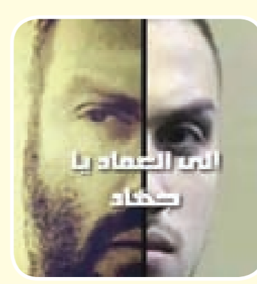
إلى العماد يا جهاد

ربما كان على «العربية» أن تتابع «هاشتاغ: الفرق بين القتل والشهيد» على «تويتر» سابقاً لكانت عرفت فعلاً معنى الشهادة!