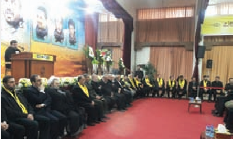
تقبل التعازي بشهداء القنيطرة في عربصالحيم