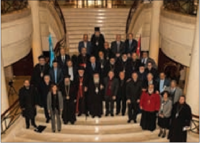
اللجنة التنفيذية لمجلس الكنائس

«هو المؤسسة التي يجتمع حولها مسيحيو الشرق وهو المعبر عن هواجسهم وتطلعاتهم». وبحث اللجنة خلال اجتماعاتها، بالخصوص، استراتيجية العمل كما اتخذت عدداً من القرارات المناسبة