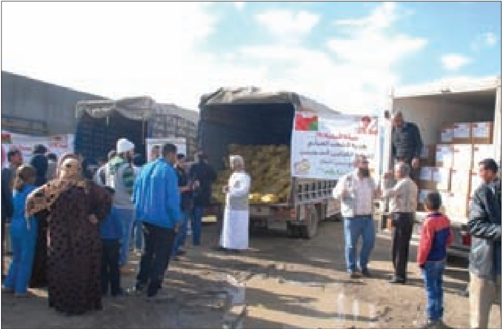
توزيع المساعدات العمانية

إقليم الخروب. من جهة أخرى، أعلن اتحاد الجمعيات الإغاثية في صيدا، انه «بعدها تم توزيع حصص غذائية على مجتمعات النازحين السوريين في المدينة، بتبويل من إحدى المؤسسات الدولية، أبلغنا أحد الأفراد أنه يوجد داخل الحصّة بعض المواد الفاسدة. وعلى الفور توجه فريق من الاتحاد، وتبين أن صلاحية المواد ليست منتهية، ولكن على ما يبدو هناك سوء في التخزين. عندها، عمدنا إلى جمع المواد الفاسدة كافة، وتواصلنا مع القوى الأمنية والإجهاات المختصة للتحقيق في الموضوع واتخاذ الإجراءات اللازمة».