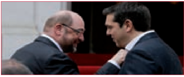
قلق أوروبي من سعي اليونان إلى التعاون مع روسيا