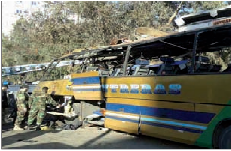
الحافلة اللبنانية المستهدفة في العدوان الإرهابي في الشام

لا تزال الحرب التي وقعت من دون أن تقع، بين المقاومة وكيان الاحتلال ترسم معالم الشرق الأوسط الجديد، على إيقاع المعادلات التي صاغها قائد المقاومة السيد حسن نصرالله في خطاب يوم الجمعة الماضي. التردّدات الأبرز في رسم ملامح الصورة الجديدة، كانت في التطور الذي جاء من اليمن بالإعلان عن مهلة ثلاثة أيام من المؤتمر الوطني، الذي يقوده الحراك الثوري، على القوى السياسية خلالها الوصول إلى صيغة لملء الفراغ الدستوري، الناتج من استقالة الرئيس وحكومته، أو يضطر المؤتمر للجوء إلى خيارات ثورية بديلة، شبهتها مصادر يمنية قريبة من قيادة الحراك الثوري، بعملية «مزارع شبعاً» سياسية تعكس موازين القوى الجديدة في المنطقة التي جاءت عملية المزارع للمقاومة تؤكد ثباتها وتثبيت معادلاتها الإقليمية، ورجّحت أن تكون بصيغة حكومة مؤقتة تدير البلاد، وتضم شخصيات وطنية مشهود لها بالكفاءة والنزاهة وسعة التمثيل تتولى خلال سنة إعداد مسودة دستور جديد، يعرض للاستفتاء وتجري وفقاً له انتخابات نيابية ورئاسية جديدة.