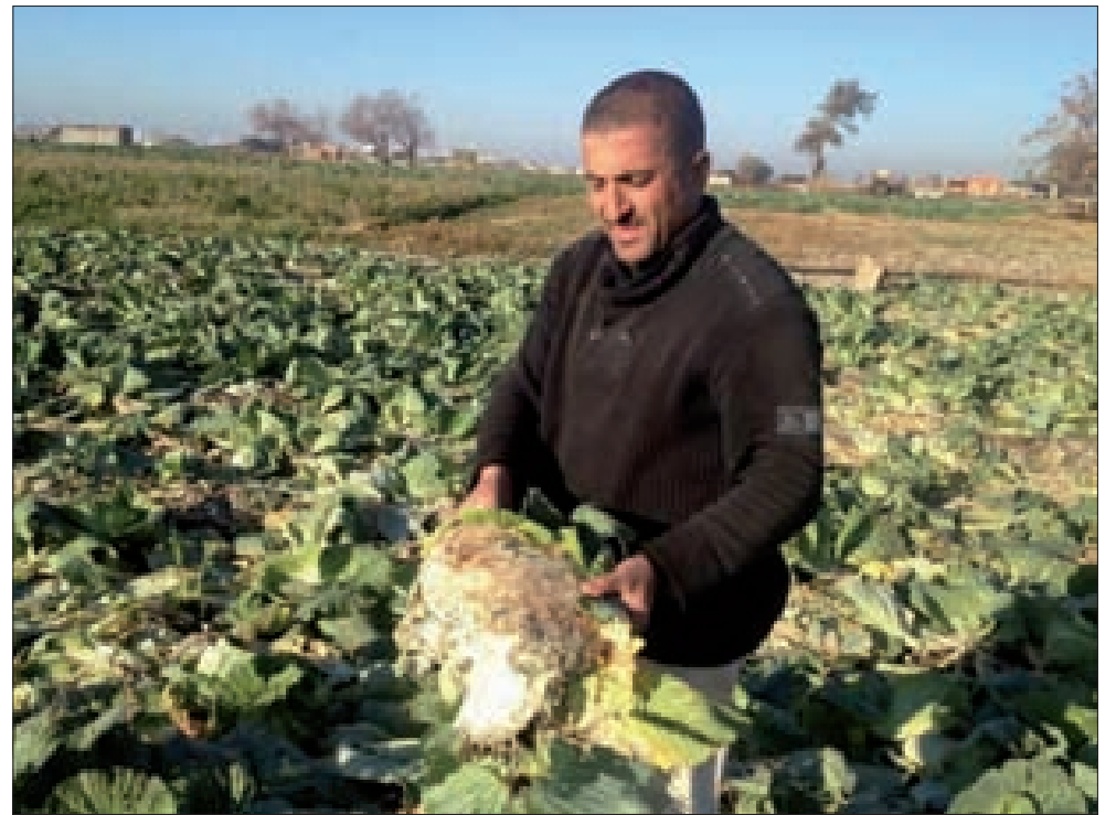
خسائر المزروعات في صور