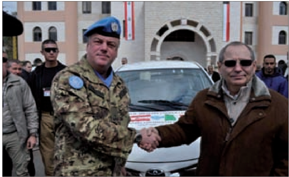
تسليم الهبة الإيطالية