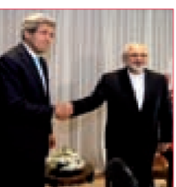
عراقجي: بلغنا مرحلة ينبغي فيها اتخاذ قرارات سياسية