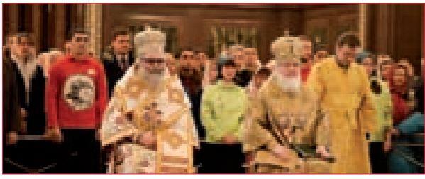
يازجي: نعول على الدور الروسي في الحوار والحل السلمي في سورية