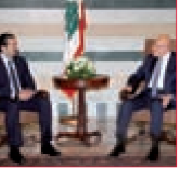
مشاورات سياسية لحسم النقاش حول تعديل آلية العمل الحكومي