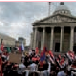
مواقف منددة بالعدوان التركي على سورية؛ استكمال لسياسة أردوغان التآمرية الداعمة للإرهاب