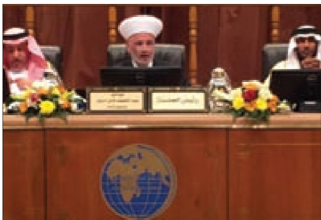
دريان متراًسا جلسة عن الإرهاب

يتخذ عدة أشكال وأنواع باسم الدين والدين براء منه، ومن يقوم بهذه الأعمال العدوانية من قتل وترويع وتهجير وتدمير ونهب وحرق للأبرياء لديه فكر خاطئ عن الدين وتصور غير صحيح عن المفاهيم الإسلامية، وعلينا جميعاً مواجهة هذا الفكر بفكر صحيح وبالحوار وينشر الثقافة الدينية المبنية على أسس غير مغلوطة».