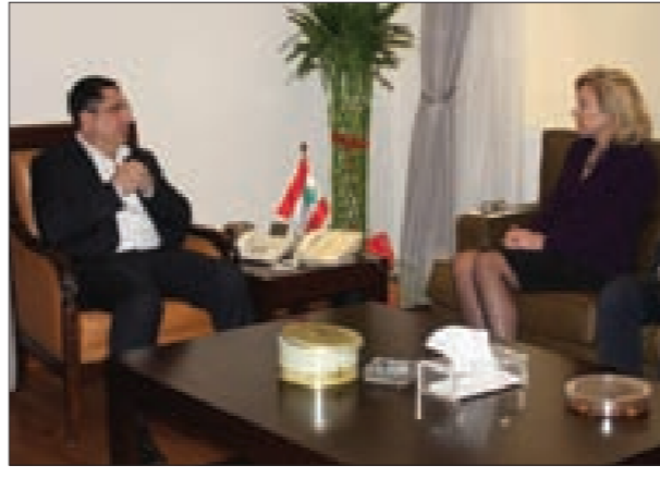
الحاج حسن وكاغ

أكد وزير الصناعة حسين الحاج حسن ضرورة أن يقوم المجتمع الدولي بدوره على صعيد وقف الإرهاب الذي لم يكن لينشأ لو لا دعم دول له بالتمويل والتسلح والتدريب، وأعطاؤه كل الإمكانيات ليفعل ما يفعله في هذه المنطقة، وبالتالي ضرورة أن يتحمل المجتمع الدولي المسؤولية تجاه هذا الإرهاب. ولفت إلى أنه «معلوم أن الأمم المتحدة لا تتحمل المسؤولية مباشرة، ولكنها تضم دولاً أعضاء فيها ويجب إلزام هذه الدول بشريعة الأمم المتحدة وبشريعة حقوق الإنسان».