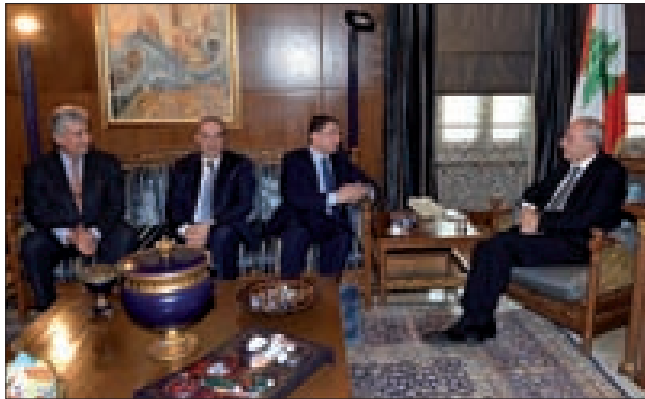
بري مجتمعاً إلى الرفاعي وفرعون

ووزير السياحة ميشال فرعون أمس، رئيس مجلس النواب نبيه بري في عين التينة. وقال الرفاعي بعد اللقاء: «عرضنا الأوضاع كافة، وخصوصاً التحسن الكبير الذي طرأ على الأرقام والتدفقات السياحية على لبنان، ولا سيما مع بدايات عام 2015. هذا كله مؤشر إيجابي، فالسياحة صناعة مهمة جداً بالنسبة إلى لبنان، ولعلنا من دولته كل دعم وتأييد لهذه الصناعة وهذا القطاع.»