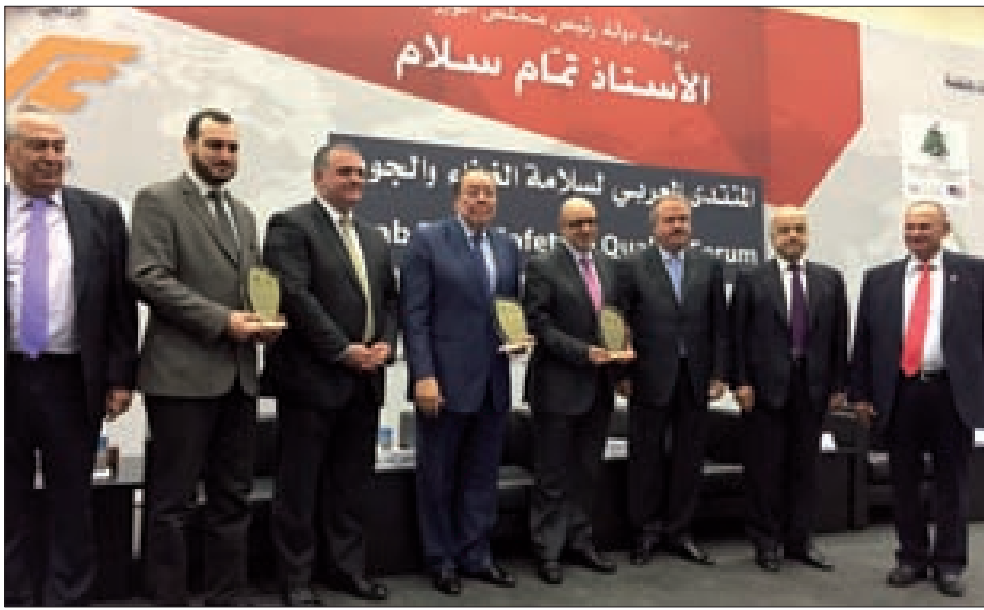
دروع تقديرية للمشاركين