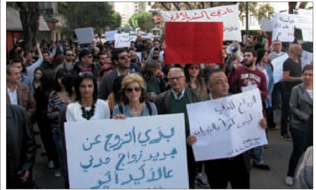
المسيرة لدى وصولها إلى وزارة الداخلية

نظمت الهيئة المدنية لحرية الاختيار مسيرة ظهر أمس، انطلقت من أمام المدخل الرئيسي للجامعة الأميركية ووصلت إلى أمام وزارة الداخلية في الصنائع، للمطالبة بضرورة تسجيل الزواج المدني. وأكد المعتصمون أنهم سيقومون ندوات واعتصامات ولقاءات وتحركات شعبية أخرى ضاغطة في هذا الاتجاه، مؤكداً أن القانون اللبناني يسمح بالزواج المدني، فليس