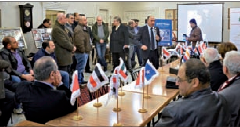
قمبيحة يلقي كلمته خلال الحفل