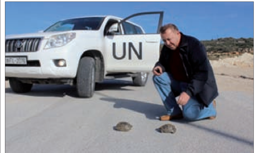
ضابط الدورية يهّم بمساعدة السلختين

وعلق الضابط لاحقاً على الحادثة: «كانت السلحتان تحاولان عبور الطريق من جهة إلى أخرى، والسلخاف كما هو معروف بطيئة الحركة، كما أن عبورها على الأسفلت يتطلب الكثير من الوقت، فأمرت عناصر الدورية بإيقاف