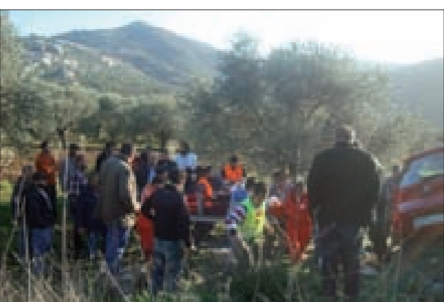
الصليب الاحمر ينقل الجندي الجريح إلى سيارة الاسعاف

الشرطة العسكرية وفتحت تحقيقاً في الحادث، وعمل عناصر الجيش والقوى الأمنية على تسهيل حركة المرور على الطريق الدولي الذي يربط المنطقة الحدودية بصيدا والجنوب، بعدما تسبّب الحادث بجزمة سير في الاتجاهين.