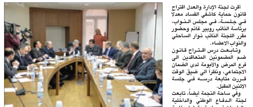
غانم مترشاً اجتماع لجنة الإدارة

أقرت لجنة الإدارة والعدل اقتراح قانون حماية كاشفي الفساد معدلاً في جلسة، في مجلس النواب، برئاسة النائب روبير غانم وحضور مقرر اللجنة النائب نوار السحلي والنواب الأعضاء. وتابعت درس اقتراح قانون ضم المضمونين المتعاقدين إلى فرع المرض والأمومة لدى الضمان الاجتماعي، ونظراً إلى ضيق الوقت قررت متابعة درسه في جلسة الاثنين المقبل. وفي ساحة النجمة أيضاً، تابعت لجنة الدفاع الوطني والدولية والبلديات في جلسة عقدها برئاسة النائب سمير الجيسر درس مشروع القانون المتعلق بالصحة الوراثية، وافقرت المادة الثانية معدلة، والمتعلقة بإنشاء قاعدة البيانات الوطنية المرتبطة بالبصمات الوراثية، والمخزن المركزي الخاص لحفظ المضيوبات الحيوية. وأقرت المادة الثالثة والمتعلقة