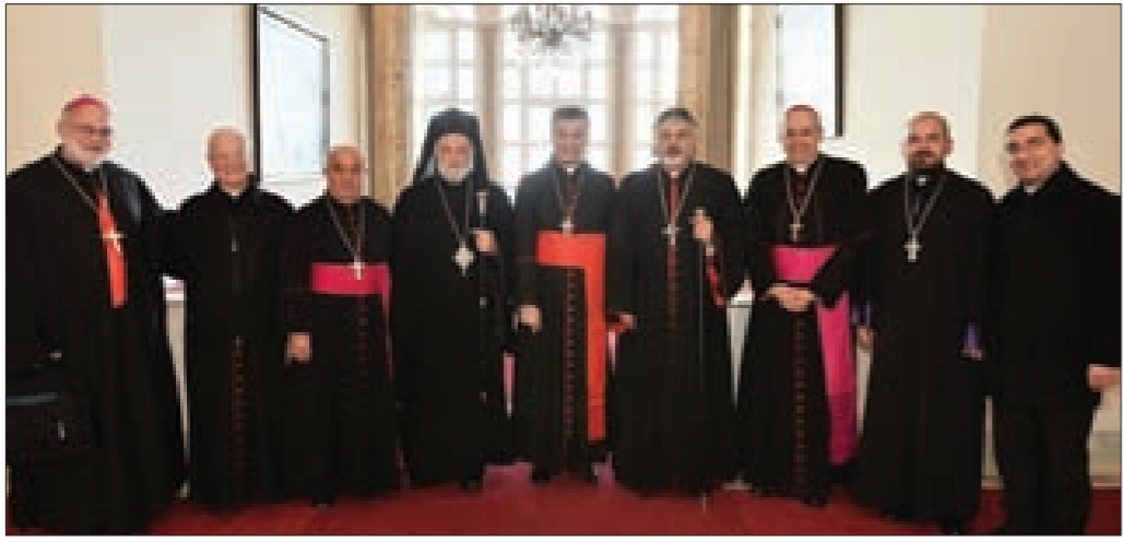
الراعي متوسطاً البطاركة والأساقفة الكاثوليك

اجتمع مجلس رئاسة البطاركة والأساقفة الكاثوليك في لبنان، لتحديد موضوع دورة المجلس المقبلة في تشرين الثاني 2015، ولتداول التقرير الذي قدمته اللجنة الاسقفية التي عينها مجلس الرئاسة في 12 تشرين الثاني 2014، بمهمة «دراسة أوضاع رابطة كاريثاس لبنان ومركز الاجانب التابع لها، وتصويب ما يلزم ورفع اقتراحها الى مجلس الرئاسة». حضر الاجتماع البطاركة: رئيس المجلس الكاردينال بشارد الراعي، غريغوريوس الثالث لحام، مار اغناطيوس يوسف الثالث يونان، ممثل المطريرك ترنسيس بديروس التاسع عشر المونسيون بارتريك موراديان، والمطران بولس صياح رئيس الهيئة التنفيذية للمجلس. توكنت اللجنة من المطرانية: سيمير مظلوم رئيساً، ايلي بشاره حداد أميناً للسسر، ويوحنا جهاد بطاح عضواً.