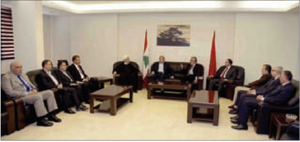
وفد من حركة أمل مهتأ اللجنة المركزية

مشيراً إلى «أننا نعود على الحوار والحوافز السياسي ودعم الجيش لتخليص هذا الوطن»، مشدداً على «أن حزب الطاشناق هو أحد أعمدة نبات لبنان والحفاظ على الوحدة بين كل المكونات». وأكد: «أن كل من يدعو إلى العصبية والجاهلية يحاول أن يوزع سومه لإيادة مجتمعات تحت عناوين طائفية أو قومية أو ما شابه». وتابع: «أن التاريخ شاهد على هذه المحطات السوداء التي أدت قلوب البشرية جمعاء بنسب متفاوتة ولحظات تاريخية متعاقبة. وأن الحل يكمن في المزيد من التمسك بالميادين الوطنية والدينية لأننا بأمس الحاجة إلى إبراز حالات التنوع والتضامن مع بعضنا للمواجهة».