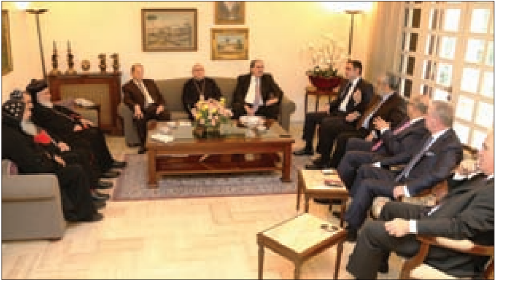
اللقاء المسيحي في الرابية

نحبي ذكرى المجازر التي حصلت في عام 1915 وطاولت هذه المأساة الكبيرة جميع المسيحيين في المشرق». وأضاف: «هناك استئصال ممنهج لوجود كل الطوائف المسيحية في الشرق (سريان، أرمن، موارنة، آرتوكس، أقباط،) واليوم، يحيى الأرمن والسريان ذكرى المأساة الكبيرة التي لا يمكن أن ينساها أحد، في حين أن المسيحيين في لبنان، الذين تم استئصالهم بالجويع، لا يؤتى على ذكركم، مع العلم أن الأحداث حصلت في الوقت نفسه».