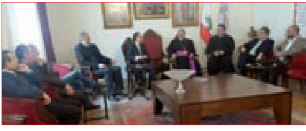
وفد من «القومي» زار مطرانية المشرق الآشورية ودعا لحشد الطاقات في مواجهة الإرهاب