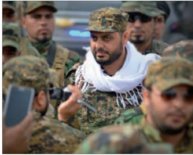
قائد عصائب أهل الحق قيس الخزعلي بين مقاتليه