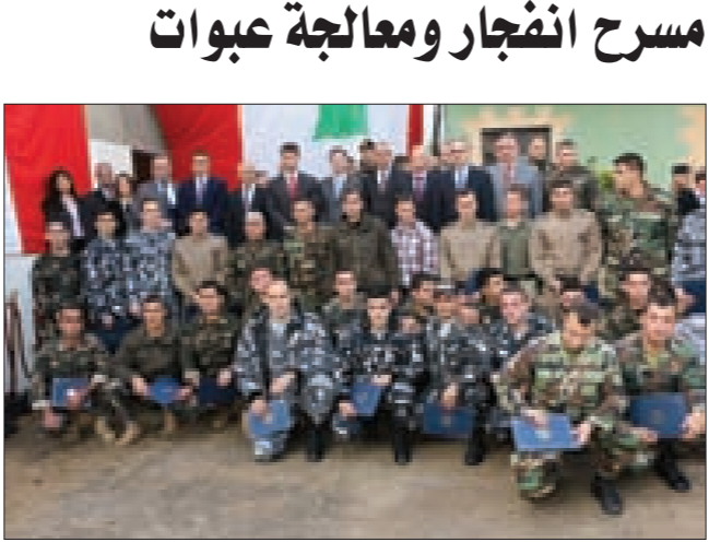
المتخرجون مع المدربين

أقيم ظهر أمس في معسكر فرع مكافحة الإرهاب والتجسس في البرزة، احتفال بتخريج دورتي «تفتيش مسرح انفجار ومعالجة عبوات غير نظامية»، تابعهما عسكريون من مديرية المخابرات ولواء الدعم في فوج الهندسة، بإشراف فريق تدريب أميركي متخصص.