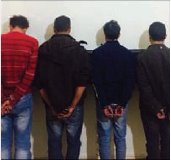
الموقوفون الاربعة لدى أمن الدولة في صغيين في البقاع الغربي

وأعلنت عن المديرية العامة لقوى الأمن الداخلي – شعبة العلاقات العامة أنه بعد توافر معلومات عن مكان وجود أحد المشتبه فيهم بترويج المخدرات في محلة الميناء – طرابلس، توجهت دورية من مكتب مكافحة المخدرات الإقليمي في الشمال في وحدة الشرطة القضائية إلى المحلة وتمكنت من توقيفه وتبين انه يدعى (ي.ش. مواليد عام 1980، متكوم القيد) وضبط في حوزته 33 قطعة من حشيشة الكيف ترزن حوالي 210 غرامات موضبة وجاهرة للترويج. كذلك أوقفت عناصر مكتب مكافحة الإرهاب في الشمال طلبة منسوبة بتهمة الاتجار بالمخدرات (ح.س. مواليد 1983) و(أ.ب.س.) مواليد 1978، عند اوتوستراد بخعون طاران في سير الضنية وأودعا القضاء المختص.