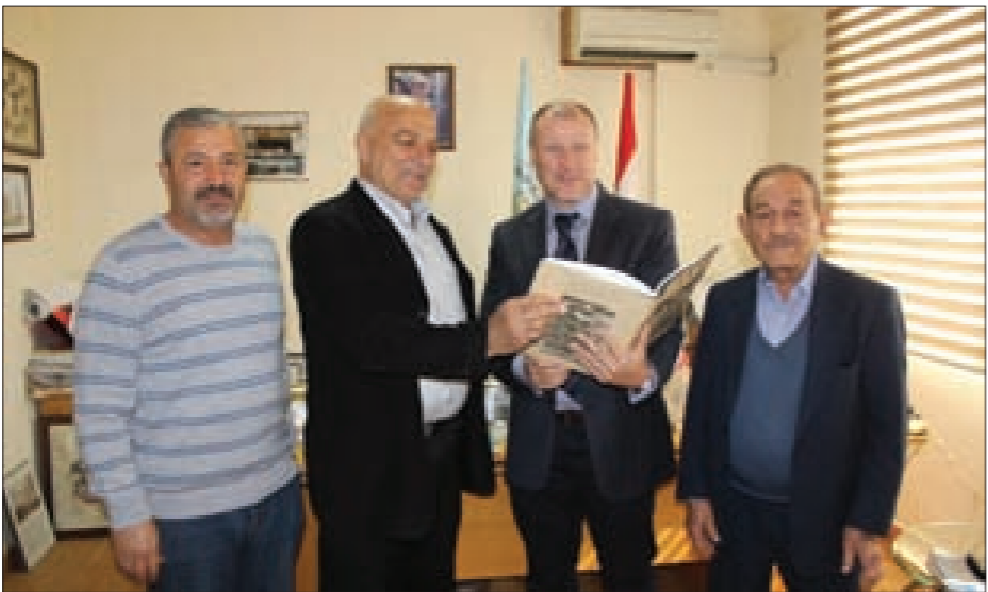
السفير الأسترالي مع رئيس بلدية صور ورئيس الاتحاد

بعدها، جال السفير الأسترالي ورئيس البلدية على أحياء صور القديمة، واختمت جولته بزيارة المطران للمونسنيول في الناقورة حيث التقى قائد اليونيفيل الجنرال لوتشيانو بورتولانو وكبار الضباط الدوليين.