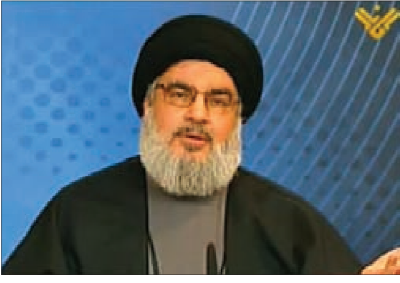
وكانت السعودية تدعم

شدد الأمين العام لحزب الله السيد حسن نصر الله على «أن العملية العسكرية التي تنفذها السعودية ودول أخرى ضد اليمن تشكل عدواناً»، لافتاً إلى أنه «على مدى عقود لم يتحرك العرب من أجل فلسطين ولبنان كما تحركوا في الحملة على اليمن». وراى السيد نصر الله في إطالة تلقبونية خصصها لبحث آخر التطورات في لبنان والمنطقة، «كنا نحلم بهبة أو نسمة حزم عربية، سواء تجاه فلسطين أو تجاه اجتياح لبنان، أو في الحرب الأخيرة على غزة حيث دمرت آلاف البيوت فيها، خصوصاً أن سكانها من أهل السنة، وكانوا يستصرخونهم، ولهذا نتفاجأ ونتالم. كل ما جرى في منطقتنا من حروب لم يستعد تدخلها سعودياً فما الذي جرى؟ ولماذا تركتم الشعب الفلسطيني لا بل تآمرتم عليه وخذلتموه عند الأميركي، وإذا كان هدفكم إعادة السلطة إلى الرئيس عبد ربه منصور هادي، فلماذا لا تستعيدون أرض فلسطين؟ وإذا كما قلتم أنكم استعترتم الخطر فلماذا لم تستشعروا خطر «إسرائيل» وهي على أبواب موانكم ومياهكم؟ كل هذا يعني أن «إسرائيل» لم تكن عدواً لكم».