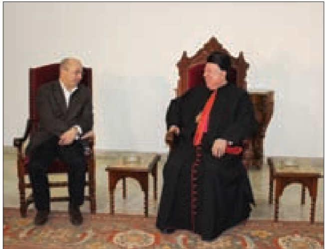
ميشال عون رئيساً للجمهورية من

فيه. الحوار مستمر وآمال اللبنانيين عليه كبيرة. وأنا أفهم هواجس الرأي العام الذي لا يرى نتيجة للحوار إلا من خلال رئاسة الجمهورية. ومن هذا أبنائها الذين تحرض عليهم. ونحن نواب ووزراء ورؤساء ومسؤولون موجودون في لبنان وجريرسون على المسيحيين لادورهم خصوصاً وعلى كل اللبنانيين عموماً، لافتاً إلى «أنه سيقبل هواجس المطران مطر إلى التمثل». وأشار إلى «أن الحوار بين التيار الوطني الحر وحزب «القوات» يمكن أن يكون الأذن الحار للحوار، لأن كثرنا قالوا إنهم مع التوافق المسيحي. وهناك مسؤولية كبيرة على عاتق هذا الحوار وأحد مفاتيح أبواب الحل في الأزمة اللبنانية موجود