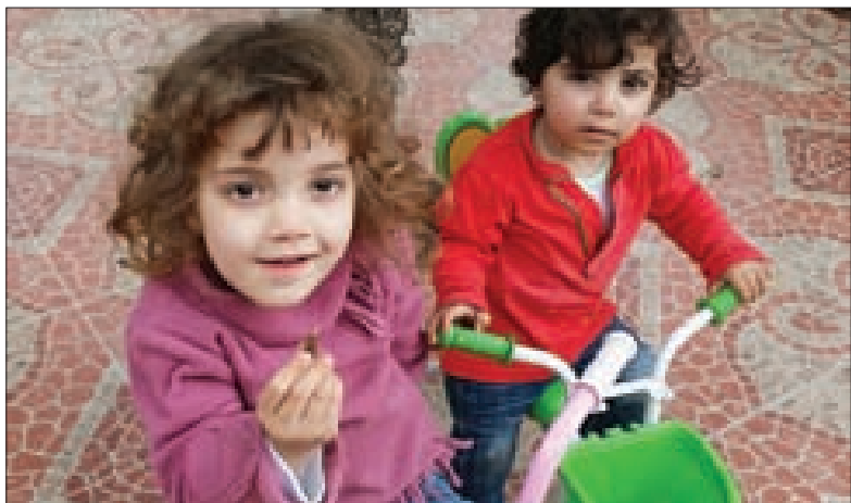
الطفلتان الناجيتان من الرصاص في بلدة الشرقية

وتضمن «على الإخوة كافة، خصوصاً، حركة حماس، ان يكون هناك عمل جاد بكل صدقية من أجل توحيد الضفة والقطاع».