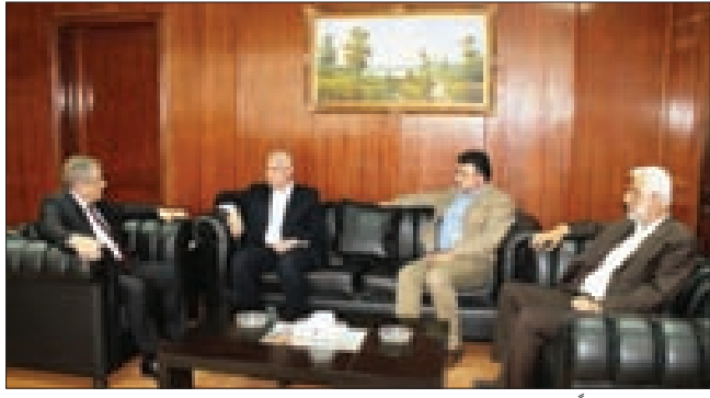
حناوي مجتمعاً إلى وفد «حماس»

ولم يظهر المنتخب الإيطالي بالشكل المطلوب في المباراة التي خاضها ضد بلغاريا (2-2) في تصفيات كأس الأمم الأوروبية 2016 حيث احتاج لإهدف من البرازيلي الأصل إيدر مارتينيز لإدراك التعادل في الدقيقة 84 من المباراة التي تقدم خلالها منذ الدقيقة 4 بهدف هدية من فيسليين مينيف الذي حول الكرة في شبك بلاده، لكنه أنهى الشوط الأول متخلفاً 1-2 بعد أن امتزّت شبكاه بهدفين في غضون 6 دقائق.