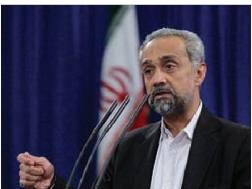
رئيس مكتب الرئاسة الإيرانية محمد نهاونديان

مبدي سياسي لتسوية الملف النووي الإيراني نهائياً، وقال: «إن روسيا وشركة الطاقة الذرية «روس أتوم» مستعدتان لتوريد الوقود الجديد للتوصل إلى اتفاق نهائي بحلول آخر حزيران». وقال وزير الخارجية التركي مولود جاووش أوغلو خلال زيارة إلى ليتوانيا: «عندما ننظر إلى مواقف مجموعة خمسة زائدًا واحدًا الآن، فإن إيران لم تصل بعد إلى الحد الذي تمكننا من بلوغه عام 2010 لكننا نأمل أن تصل إلى هذا الحد». وأضاف: «في ما يتعلق بتركيا، نحن سعداء جداً بانتهاج المفاوضات مع مجموعة خمسة زائدًا واحدًا بفهم سياسي. سعداء بأن نرى توافقاً على الإطار العام لاتفاق نهائي. وأمل أن تتوصل الأطراف إلى الاتفاق النهائي». وقال وزير المال التركي محمد ميشمشك إن الاتفاق الذي يمكن أن يهدم الطريق إلى رفع العقوبات الاقتصادية عن إيران سيساعد في زيادة صادرات تركيا لجارتها وفي خفض أسعار النفط العالمية. فقال إن شركة «روس أتوم» مستعدة لتوريد الوقود النووي إلى إيران وسحب الوقود المستنفد من جميع المفاعيل الإيرانية التي شاركت روسيا في تشييدها. وجاءت تصريحات ريباكوف بعد انتهاء المفاوضات النووية، وذلك بالتوصل إلى اتفاق