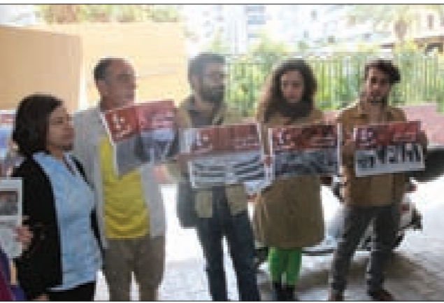
خلال اطلاق الحملة (تَوَرُّ)

أطلقت لجنة أهالي المخطوفين والمفقودين في لبنان «وحملاً تعرف،» حملة «40 الحرب»، لمناسبة مرور 40 عاماً على بدء الحرب في لبنان، على أن تستمر الحملة 40 يوماً، عبر أربع صور، كل صورة منها تطرح سؤالاً تنتشر في شوارع وطرق لبنان، وترجع على صفحات وسائل الاعلام الورقية والالكترونية وعلى شبكات التواصل الاجتماعي. إطلاق الحملة جاء في مؤتمر صحافي، في مسرح «دوار الشمس» - الطيبة، حضره وزير الاعلام السابق طارق متري وشارك فيه الي رئيسة لجنة أهالي المخطوفين والمفقودين في لبنان ودا حلواني، وعدد من ممثلي هيئات المجتمع المدني، ناشطون وناشطات، اعلاميون وأهالي المخطوفين والمفقودين والمخفيين قسراً.