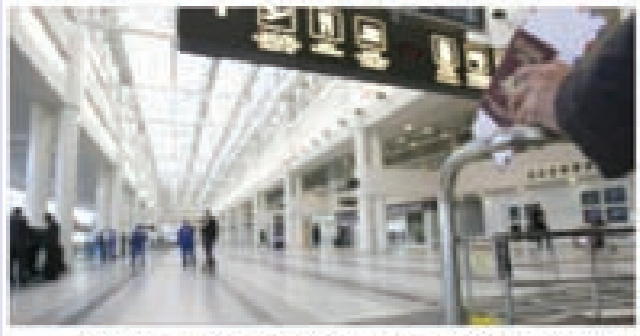
عسيدة هيسورة كادت تنسحب بتأثرها في مطار بيروت... فهي هل كانت ستعمل كرمى في مطار ريف الميسورة بسبب حالة الهلع التي...

كارثة كبيرة كانت ستحصل في مطار بيروت الدولي بسبب توقف طائرة متجهة إلى العاصمة اللبنانية بشكل مفاجئ. أما الأسباب - بحسب الرواة - فكثيرة. راكبة أفريقية، نقص في الوقود، إلى أسباب أخرى. فمن يكون الصادق؟ في التفاصيل، إن ريان الطائرة الذي كان يقودها بسرعة كبيرة تحضيرا للإقلاع، توقف فجأة على نحو أثار الذعر بين الركاب، ما أدى إلى ارتطامهم بالمقاعد، وأصيب بعضهم بهستيريا ونوبات عصبية، خصوصا النساء اللواتي بدأن بالصراخ والبكاء. بعد نحو ريع الساعة، خرج الريان من قمرته ليطمئن الركاب أن لا شيء يستدعي الهلع، وجل ما في الأمر أن الطائرة بحاجة إلى وقود. وما إن انتهى الأمر، سقلع الطائرة. وما هي الا لحظات، حتى لاحظ الركاب دخول راكبة أفريقية يبدو من مظهرها أنها «ميسورة»، فجن جنون أحد الركاب الذي بدأ بالصراخ متمها الكابتين والمضيفات بأن الطائرة توقفت فجأة كرمى لعيون هذه الراكبة، وأنهم غير آبهين بباقي الركاب، خصوصا أن ركابا كادوا يفقدون حياتهم بسبب الخوف الذي انتابهم. حاولت المضيفة تبرير ما جرى للراكب الذي «فقد أعصابه» بسبب ما وصفه بالاستخفاف بمشاعر الركاب لإرضاء راكبة يمكن أن تكون مدعومة من زعيم ما، لكنه لم يفتنع، فكيف تقلع طائرة من دون أن تكون ملوثة بالوقود؟ أقلعت الطائرة أخيرا إلى أكرا... لكن ثمة سؤال يبقى يحير الركاب: لماذا توقف الريان فجأة؟ ومن هي تلك السمرء؟