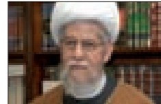
العلامة الشيخ غيف النابلسي

تتكشف يوماً بعد يوم مآزق آل سعود على رغم كل المزاعم بأن ما يحصل من تغييرات في هيكل الحكم يصب في تثبيت دعائمه. لكن هذا الزعم لا يخلو فوق المظهر الجديد الذي يكشف حجم التناقضات داخل العائلة الحاكمة وعمق الخلافات التي وصلت بالصحافة الغربية للتحدث عن نهاية ممالك الشيوخ والأهراء.