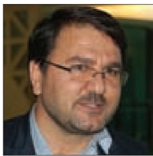
نعمتي نعيمتي لـ «أبناء فارس» : مشروع قرار وقف المفاوضات النووية سيوضع على جدول الأعمال عند الحاجة

منازلها وعوائلها وتعرضت للقتل ومورست بحقها أبشع الجرائم وسياسة الأرض المحروقة التي تنتهجها السعودية ومن معها، وأضاف: «جبل تولى الذي سيطرت عليه القبائل اليمنية مطل على منطقة الخوبة السعودية وفيه مواقع استراتيجية ومن خلاله يمكن ضرب أي هدف داخل الأراضي السعودية أبعد من نجران وجيزان، ومن يسيطر عليه يجتري أنه يتحكم في زمام الأمور بالنسبة إلى القصف الميداني والمدفعي». وتابع: «هناك تقدم ميداني واشتباكات بالأسلحة الخفيفة والثقيلة داخل وادي نجران واستهدفت مناطق في نجران وجيزان وهناك كتيبة سقطت من اللواء السابع وكتيبة من اللواء الثامن التابع للحرس الوطني السعودي وهناك أسرى وجرحى وقتلى من الجانب السعودي. وهذا هو مصير المعتدي». وقال: «نحن نقاوم [إسرائيل] بكنة عربية، السعودية ليست أقل بشاعة من [إسرائيل] التي لم تستهدف القبور لكن السعودية استهدفت القبور ودور العبادة والمساجد وضريح السيد القائد حسين بدر الدين». وأوضح الزعيم القبلي أن «الرد لم يبدأ بعد وما يجري هو رد من قبيلة أو قبيلتين أو مجموعة أو مجموعتين، فما بال السعودية حين يتحرك الشعب اليمني للرد على عدوانها؟»، مضيفاً: «هناك تكتم شديد من الجانب السعودي على عدد قتلاه ومصايبه في نجران وجيزان وهم يفرون منها والدعوى في قلوبهم». وكشف أبو هدره أن «أبناء القبائل اليمنية على الحدود سيطروا على معدات من المواقع العسكرية السعودية حديثة ونوعية أميركية الصنع وأسلحة حديثة تابعة للحرس الوطني السعودي».