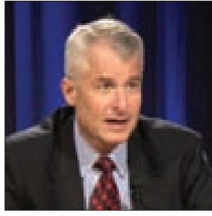
CNN: «داعش» قلب أسس تفكير «القاعدة» باستهداف كل أميركي

وقال الشيخ حسن أبو هدره إن «ما يجري في الحدود هو رد فعل طبيعي من القبائل اليمنية التي تم استهدافها».