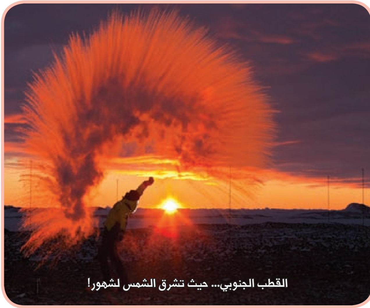
القطب الجنوبي... حيث تشرق الشمس لشهور!

2 - «مخاطر الدور التركي في المنطقة العربية» - د. صالح زهران - ص 21.