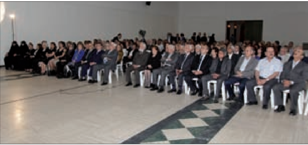
جانب من الحضور خلال الاحتفال التكريمي