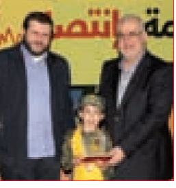
إشادة واسعة بالمقاومة في العيد الـ15 لانتصار أيار