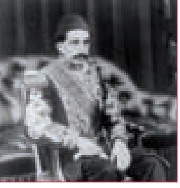
ثيودور هرتزل باع الأرمين للعثمانيين فكانت مذبحه الإبادة...