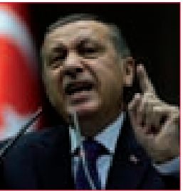
العلاقات مع «إسرائيل» في ميزان الانتخابات التركية