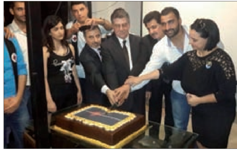
قطع قالب الحلوى

تاريخ الأمة السورية ومبادئ النهضة. ودعت إلى العمل على نشر فكر سعادة وتبنيه في مختلف المواقف الحياتية من أسبغها إلى أكثرها أهميّة، إضافة إلى تشكيل مجموعات واسعة من القوميين المؤمنين بما منحهم إياه أمّتهم من قدرات وطاقات وأخلاق.