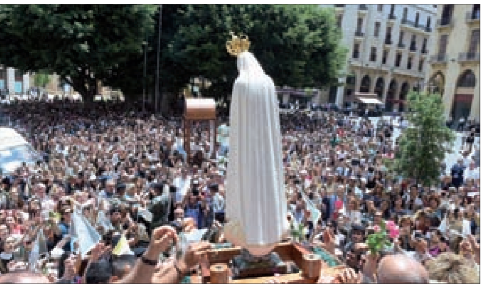
حشود تحيي بعذراء فاطيما في ساحة النجمة

وتمنى النائب كنعان أنّ «تكون بركة العذراء على لبنان وعلى هؤلاء الناس المؤمنين الذين احتشدوا اليوم في ساحة النجمة ودخل قسم منهم إلى مجلس النواب وتمنيا من الله ومن بركة العذراء تغليب رأي الناس والشعب وتطلع إلى مصلحة الشعب وأولوياته الحياتية الملحة وانتخاب رئيس صالح للجمع ولوطن».