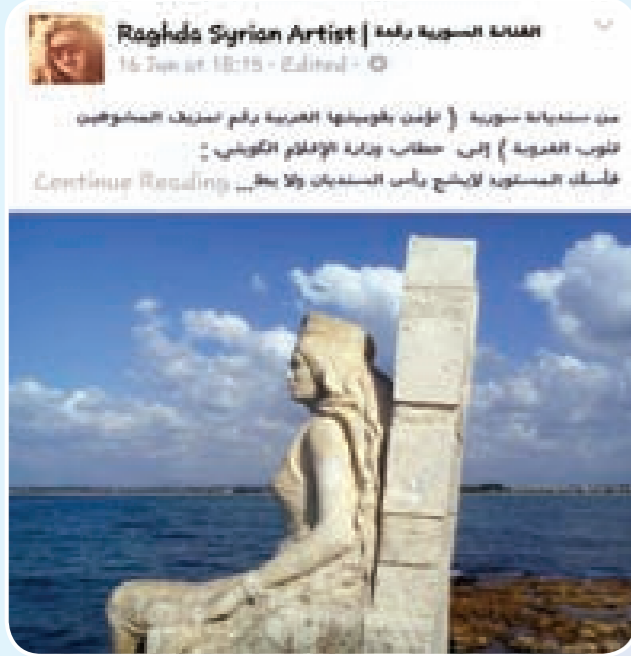
السيدة رغدة في الكويت، وهي من الفنانين الذين شاركوا في المعرض الفني الذي أقيم في الكويت.

تصدرت مانشيتات عديدة أبرز صحف الكويت في الأيام الماضية تتناقل قراراً جديداً لوزير الإعلام الكويتي يقضي بمنع عرض أي عمل فني (برناسج - مسلسل - فيلم) تظهر فيه رغدة عقاباً لها لتهديتها «لإستقلال الكويت وسيادتها» بتصريح صحافي! وبعد هذه العناوين العريضة بمنع أعمال رغدة في الكويت جاء الرد من النجمة السورية القديرة رغدة عبر صفحتها على «فايسبوك» تقول فيه: «من سنيديانة سورية (تؤمن بقوميتها العربية رغم تمزيق المشوهمين لنوب العربية) إلى خطاب وزارة الإعلام الكويتي: «فأسك المستورد لا يشج رأس السنيديان ولا يطاله وإن جرح قدمه فجزرها ممتد في طين لا يعرف شفاؤه أمالك ساترك لأمر بلادك وشعبها ومثقفها وفنانيتها بتاريخهم وقدرهم وقيمهم الرد على من يترك كل هموم الأمة في هكذا ظرف تاريخي حرج لينشغل بتشويه امرأة حرة وفنانة ملتزمة ومثقفة عملية يتطابق فعلها مع ثقافتها. ولا تعير طعنها ظهرها الثقافة ألم بقدر ما تطلق كل أنات وأنين ألها من المشوهمين المغيبيين عن ضمير القادم وغريزة الحاضر».